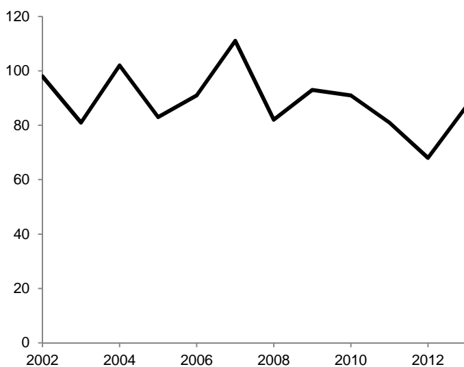
Figur 1. Antal konstaterade fall av dödligt våld 2002–2013.

För mer information om utvecklingen av det dödliga våldet i ett längre perspektiv, se kapitlet Dödligt våld i Brottsutvecklingen i Sverige 2008–2011 1 .