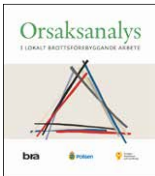
Orsaksanalys i lokalt brottsförebyggande arbete. Handbok. Stockholm: Brottsförebyggande rådet (2018).