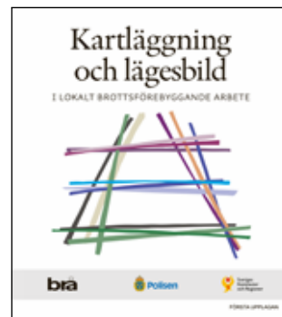
Kartläggning och lägesbild (1:a uppl.) Handbok. Stockholm: Brottsförebyggande rådet (2021).