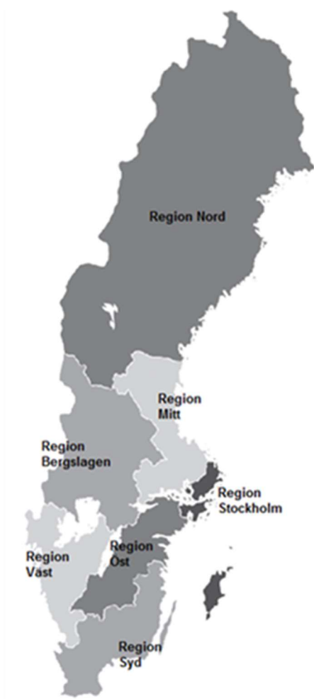
Tabell 12. Länens indelning i polisregioner och befolkningsmängd i respektive polisregion 2023.