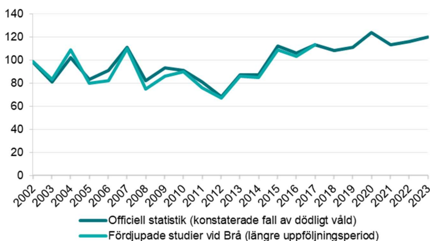
Figur 4. Jämförelse av konstaterade fall av dödligt våld med studier med längre uppföljningsperiod än 3 månader.

Vid en jämförelse av statistiken över konstaterade fall av dödligt våld med fördjupade studier som är framtagna med längre uppföljningsperiod, visar det sig att de fördjupade studierna oftast innehåller något färre fall än den officiella statistiken. Skillnaderna är små med en differens som varierar mellan 0 och 6 fall per år. (Se figur 4)